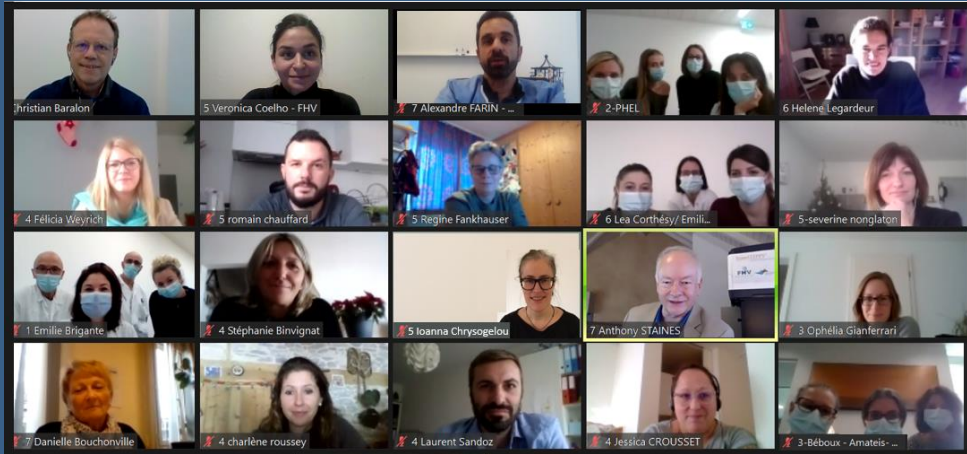
Formation de formateurs TeamSTEPPS en ligne (déc 2020)